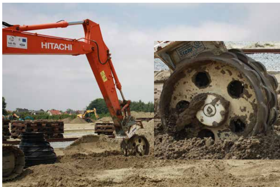
Verdichting van bovenlaag