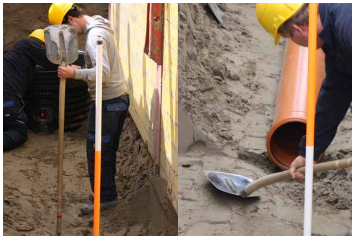
Fundering - aandacht lengteprofiel - uitsparing mofverbinding