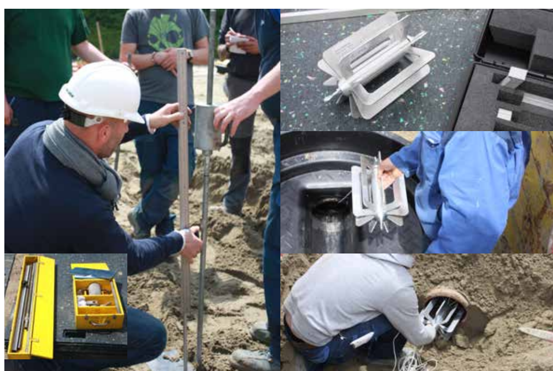
Verdichtingscontrole met lichte slagsonde Zelfcontrole deformatie met KURIO-kit

KURIO vzw: Belgische vereniging van fabrikanten van kunststofleidingssystemen.