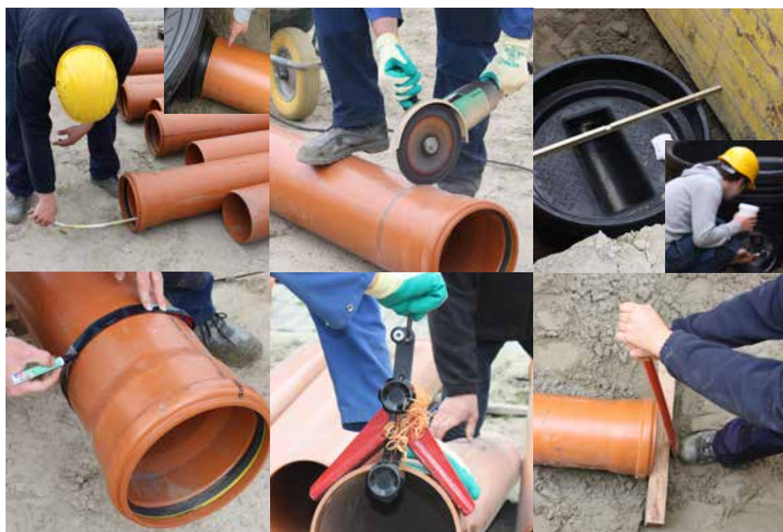
Montage: aftekenen - verzagen - aanschuinen - invetten - insteken