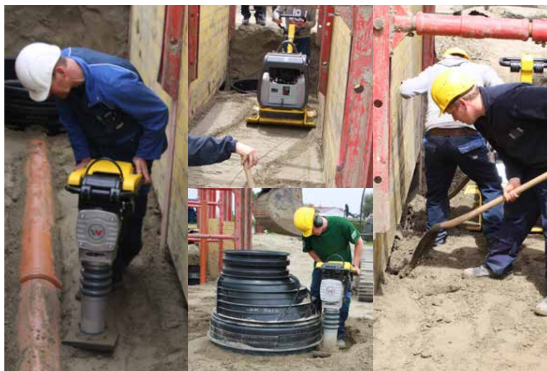
Verdichting laagsgewijs buis & putten - ondervulling damwanden