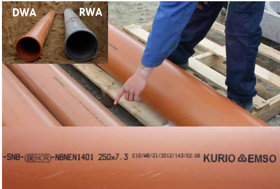
Controle materiaal - markering en respect kleurcode